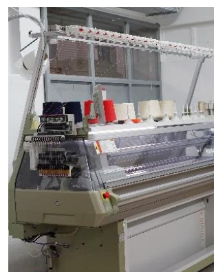
Máquina Shima Seiki